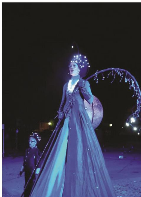
Un spectacle qui a transporté le public.

Une histoire d'étoiles a charmé le public. La lumière, la musique et le chant faisaient partie de ce spectacle enchanteur et comme deux anges de passage, les allumeurs d'étoiles de la Cie Lilou ont allumé le ciel et subjugué l'assistance. Un spectacle apprécié, une bouffée de beauté et de volupté. Montés sur leurs échasses, les allumeurs d'étoiles allient majesté et noblesse, les effets pyrotechniques soutiennent les effets de lumières, qu'accompagnent les chants lyriques.