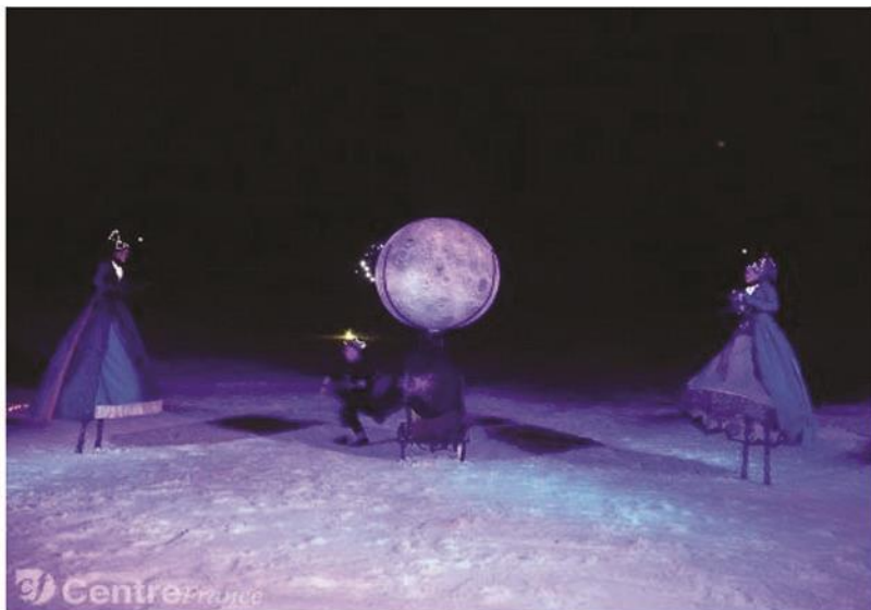
Lumière et étoiles pour une pause nocturne. - Hermouet Annick

«Spectacle magnifique, voix superbes Félicitations et remerciements pour ce moment magique.»