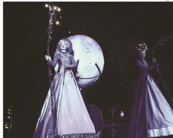
Les échassières se sont faites messagères des étoiles.