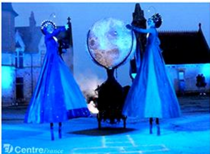
La compagnie Lilou a proposé un spectacle très onirique dans le majestueux château de la Crête.

Métons cette année le dixième anniversaire de la troupe et, ce soir, nous avons senti un public vraiment captivé par notre histoire. - Lieu de passage des Templiers