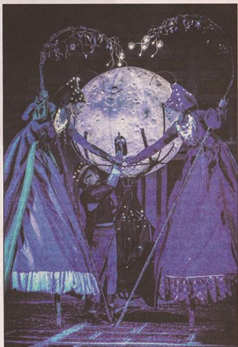
Dans ce spectacle, la rue est la scène. Deux étoiles évoquent l'espoir. Du murmure au chant lyrique, elles invitent le public à partager un temps de poésie. Rendez-vous samedi, 21h, à la tombée de la nuit...