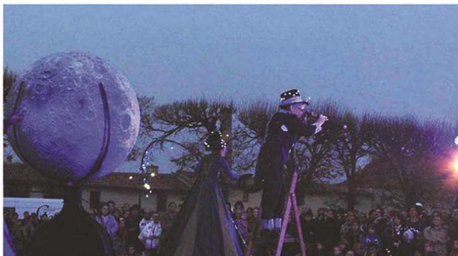
Les « Allumeurs d'Étoiles », un spectacle poétique pour illustrer la semaine du livre jeunesse à Luçon

Avec le spectacle Les allumeurs d'étoiles , les organisateurs de la Semaine du livre jeunesse ont trouvé un autre moyen de faire rêver petits et grands. Avec les différentes activités autour de la thématique de la semaine, « La tête dans les étoiles », l'objectif était d'exciter l'imaginaire des jeunes mais aussi peut-être leur esprit scientifique. Proposer un spectacle, en extérieur, gratuit, c'était une première pour la médiathèque et ce fut une réussite vu les centaines de spectateurs qui se sont pressés place Leclerc, samedi soir.