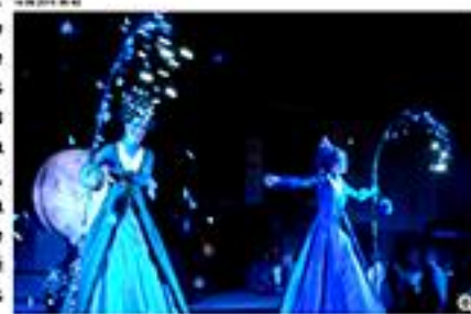
Les allumeurs de la Crête à Montluçon. Les allumeurs d'étoiles dans l'enceinte du château de la Crête.

Le festival Remp'arts connaît un succès croissant. Le troisième spectacle a attiré quatre cents spectateurs au château de la Crête à Audes, mardi soir. La compagnie de Lilou avait choisi d'allumer les étoiles.