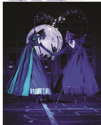
Les Allumeurs d'étoiles. - photo DR David Pommier

Montluçon Auvergne > Allier > Montluçon 03/04/14